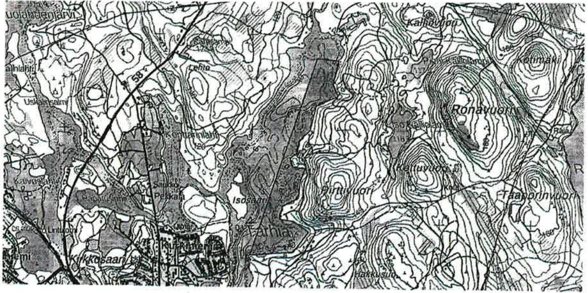
Kuva 1. Kaikki pyydystavat on sallittu kuvassa näkyvällä alueella ja verkkokalastus 55 mm tai sitä suuremmilla silmäkoon verkoilla läpi vuoden. Taimenet on vapautettava.

Kalatalousalueen hoitosuunnitelman mukaiset pyydysrajoitukset ovat voimassa osakaskuntamme alueella. Tarkemmin kalastusrajoitus.fi ja OstaLuvat.fi Kalastajat ovat velvollisia selvittämään rajoitukset kalastamillaan alueilla. osakaskunta ei lisännyt tähän mitään omia rajoituksia. Tarhian itärannalla saa kalastaa ympäri vuoden myös verkoilla joiden silmäkoko on 55mm tai yli.